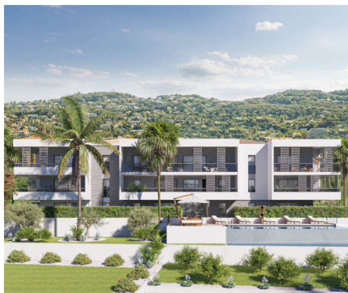
LA PALME - Cannes