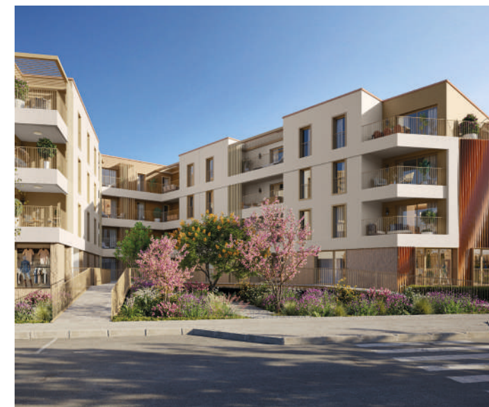
ANNA - Fréjus