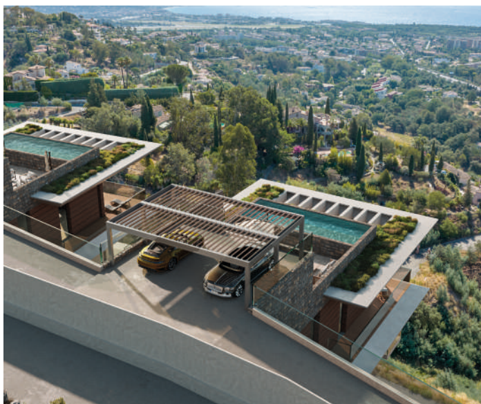
SIX - Mandelieu-la-Napoule