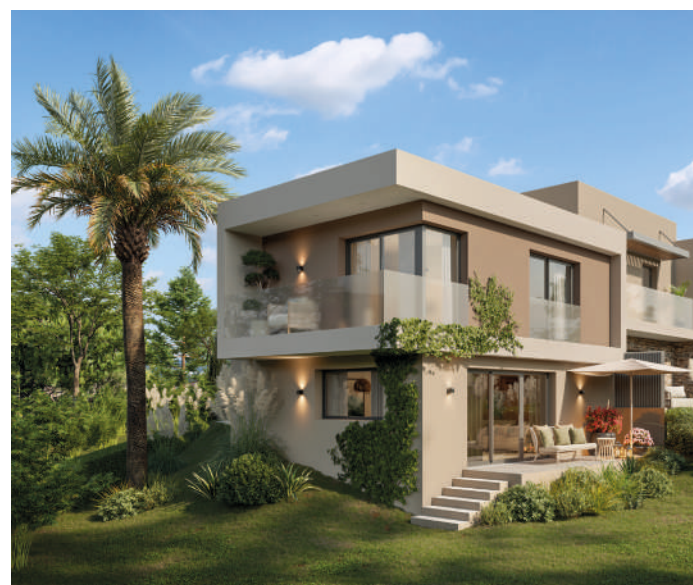
VÉLA - Saint-Raphaël