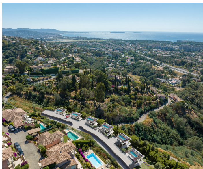
SIX - Mandelieu-la-Napoule