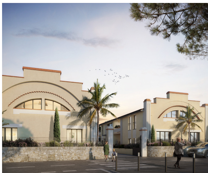
LE LOFT - Juan-les-Pins