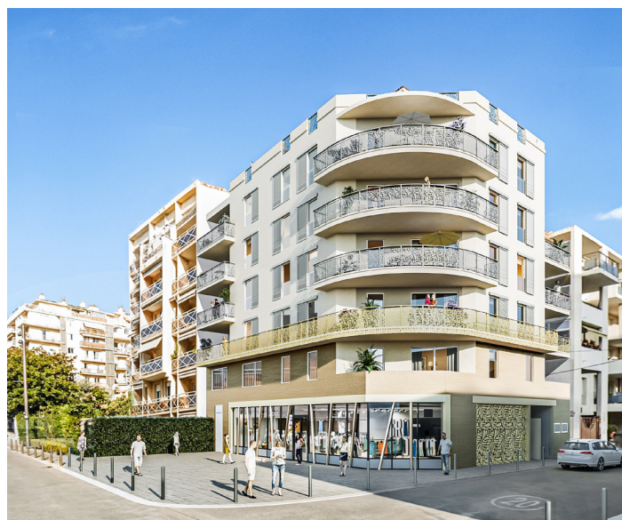
CASSANDRE - Cannes-la-Bocca