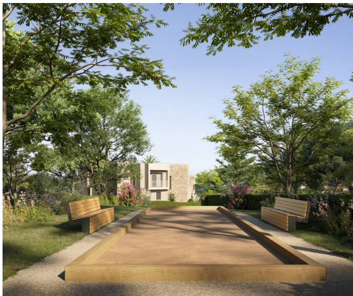
VELA - Saint-Raphaël