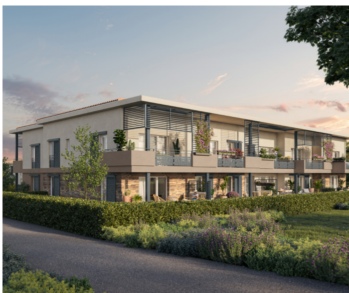
FLEUR DU NIL - Draguignan