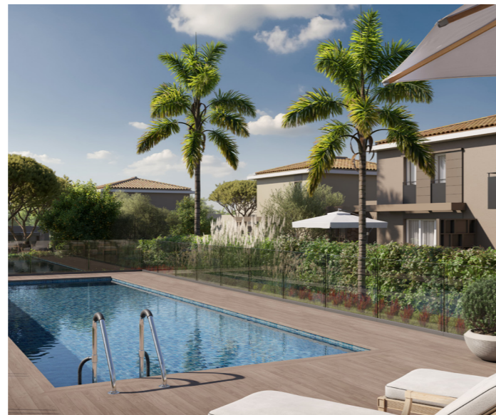
TERRA BIANCA - Vidauban