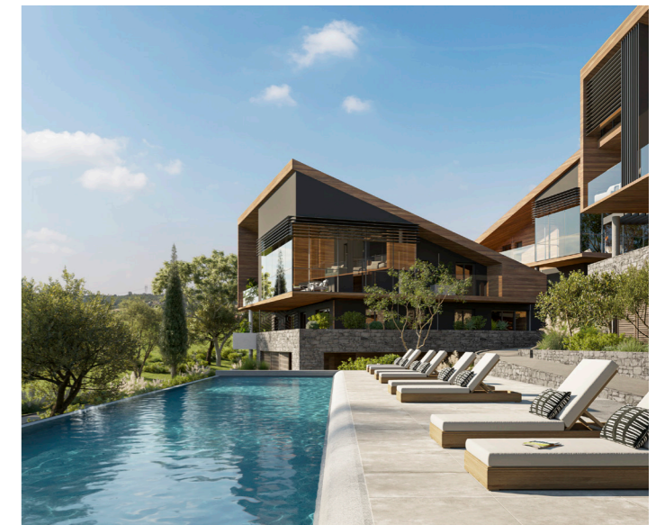
ALBATROS & EAGLE - Châteauneuf