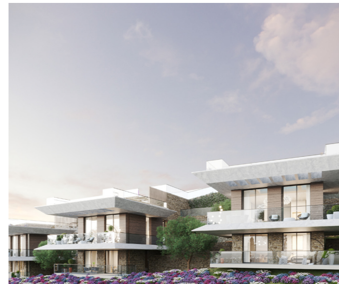
SIX - Mandelieu-la-Napoule