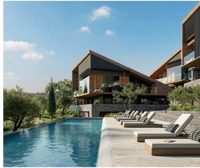
ALBATROS & EAGLE - Châteauneuf