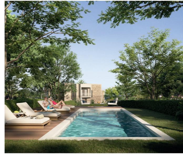
VELA - Saint-Raphaël