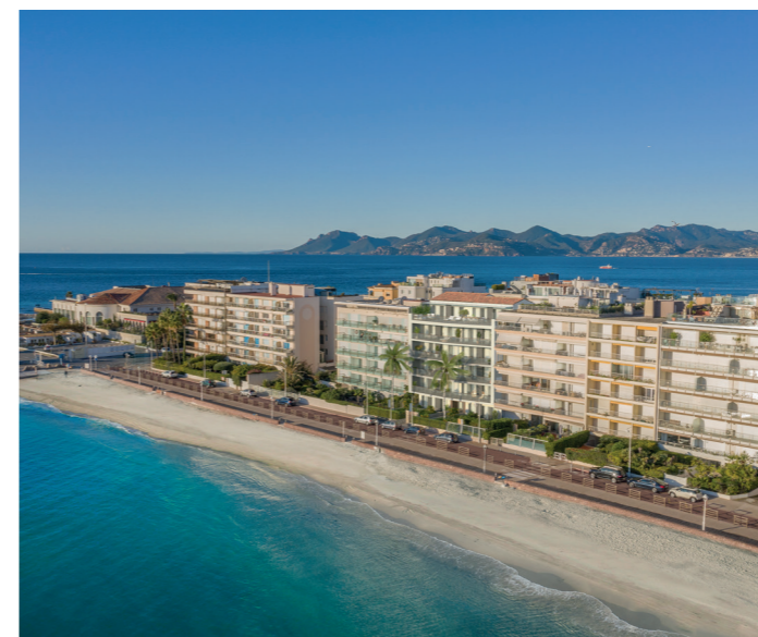
HÉLIOS - Cannes