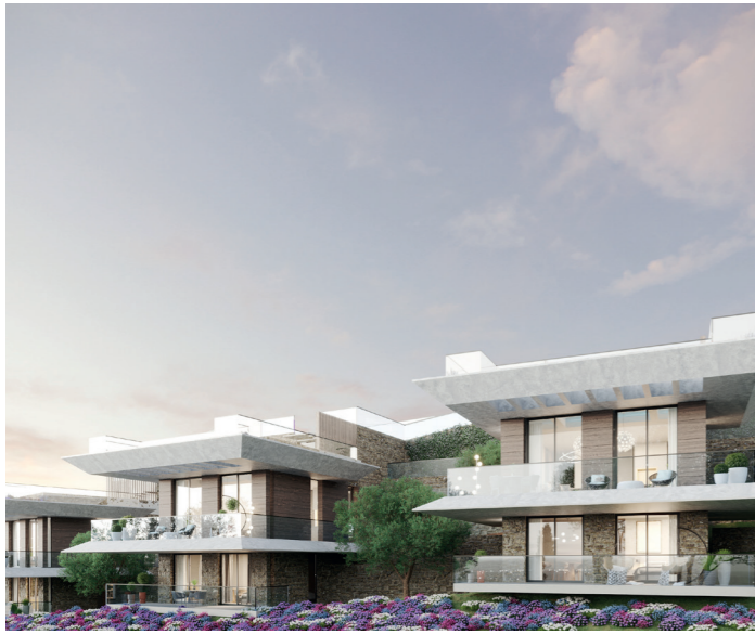
SIX - Mandelieu-la-Napoule