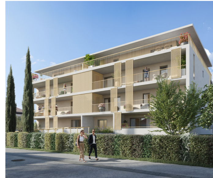
DOLCE MIA - Fréjus