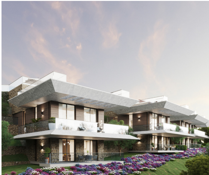
SIX - Mandelieu-la-Napoule